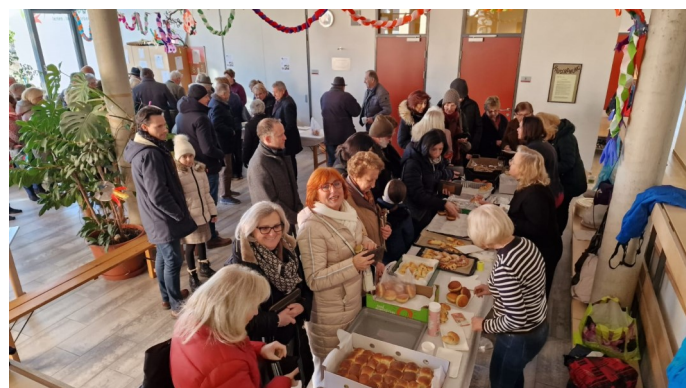
Krapfen- und Germteigsonntag - DANKE an alle

Alle Fotos zu den Veranstaltungen finden sie auf der Homepage lang.graz-seckau.at