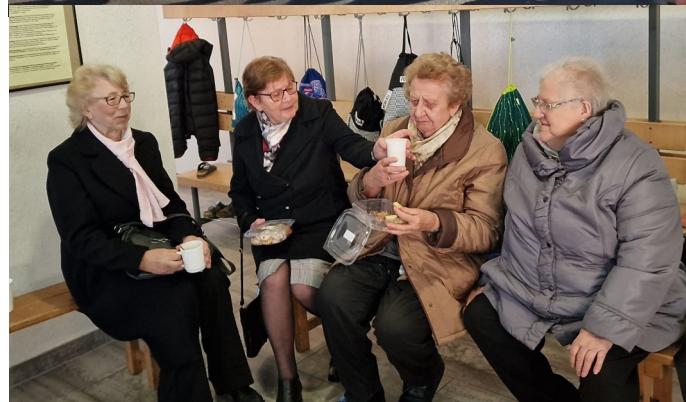
Nikolofeier - eine Freude für Groß und Klein!