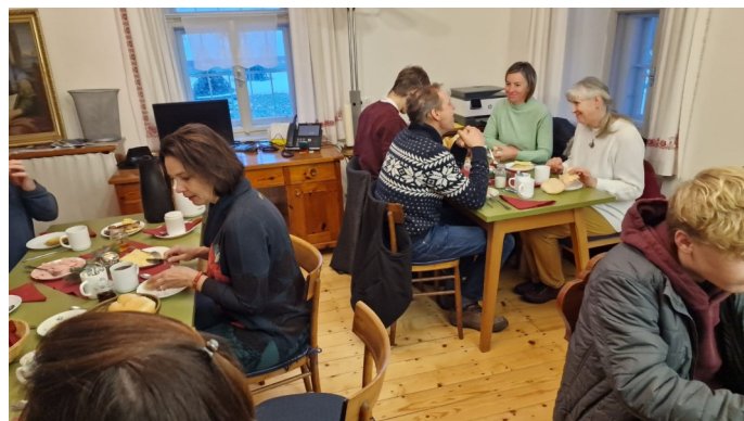
Rorate - mit viel Liebe gestaltet und gut besucht